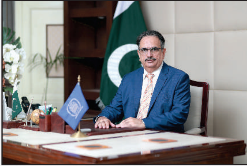
معزز اراکین چیمبر