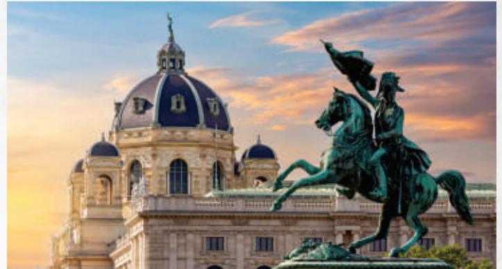
(Symposium of Vienna-Austria)