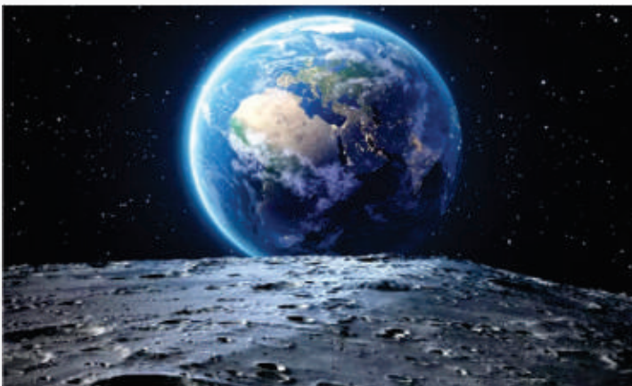
Moon was closest to earth on Jan 21, 2023 after 993 years i.e the 'Middle Ages'

Similarly, some people find travelling as a medium to groom their personalities, enhance their confidence level and enrich their treasures of knowledge from whichever strata of society they may belong to. Travelling surely changes one's personality and makes him decent, intelligent, independent and self-confident. In short, travelling is not only beneficial for your physical health but also for your mental health. It enlarges longevity of your life-span and definitely improves your mental health. It gives you self-confidence as well as the power to stick firmly to your vision or perspective. It will not be wrong to say that in one way or another, it inhabits a new soul into your body.